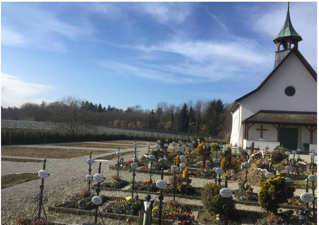
Neuer, erweiterter Friedhof Dozwil

Sterb' ich, in Tales Grunde will ich begraben sein; singt mir zur letzten Stunde beim Abendschein: Dir o stilles Tal, Gruss zum letztenmal!