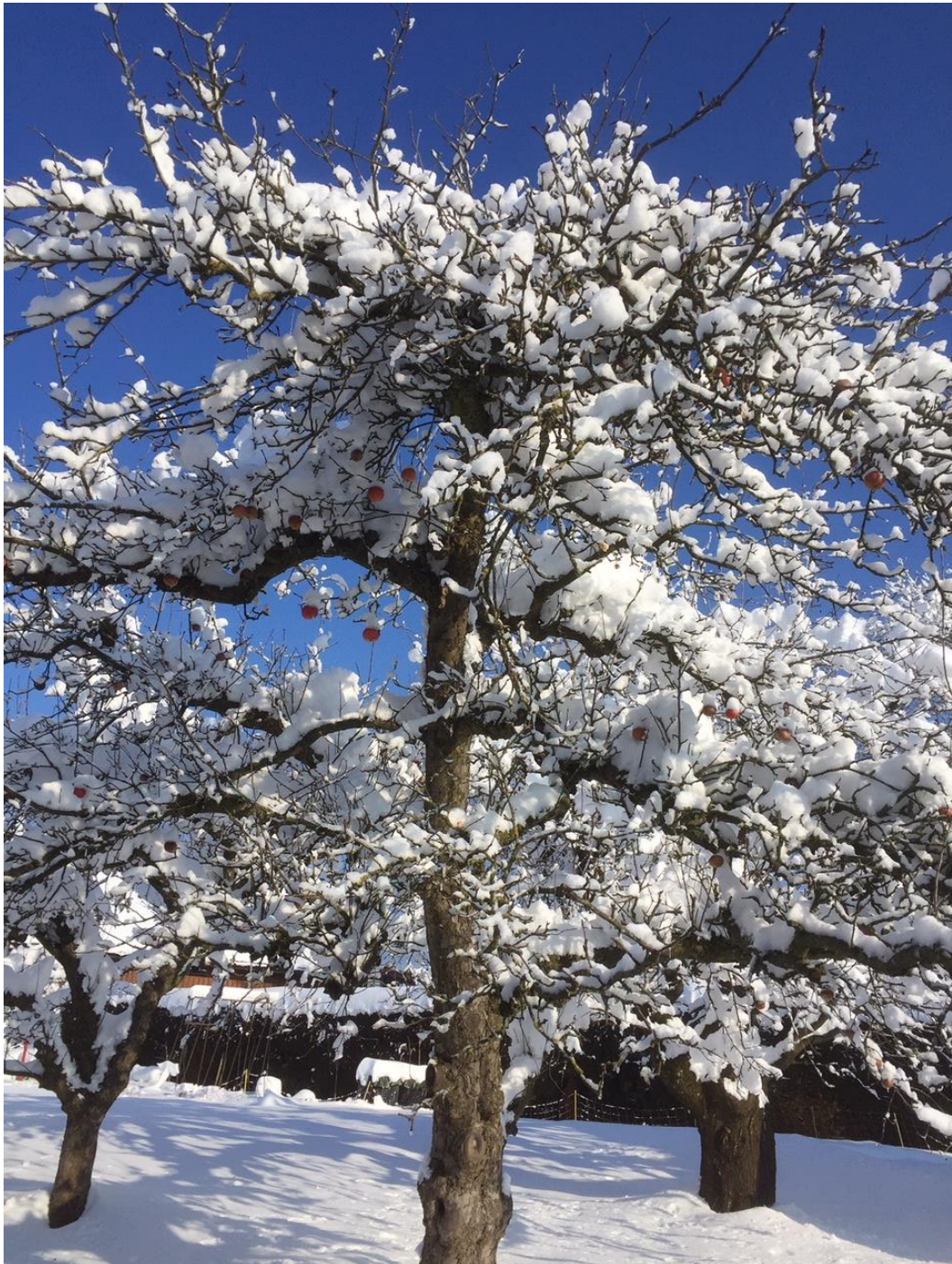
WINTER IM UNTERDORF DOZWIL, JANUAR 2021

DIE ZUKUNFT HÄNGT DAVON AB, WAS WIR HEUTE TUN (MAHANDRA GANDHI, INDISCHER RECHTSANWALT, 1869 – 1948)