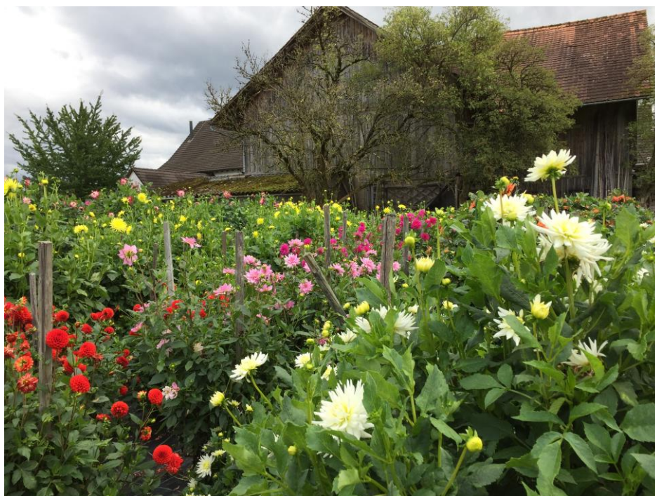
Dieter's Blumenparadies im Oberdorf Das nächste Mitteilungsblatt Nr. 170 erscheint Ende September – Anfang Oktober 2018