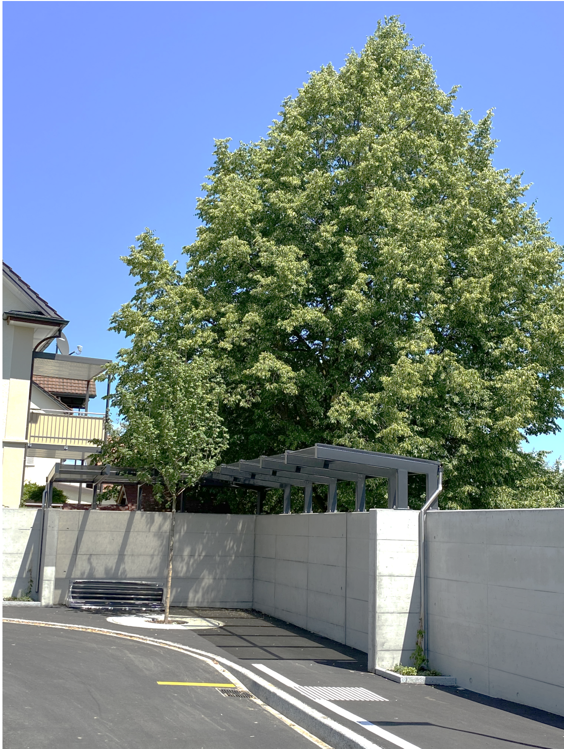
ERÖFFNUNG DER NEUEN BUSHALTESTELLE „PÄRKLI“ AM 1. JULI 2023